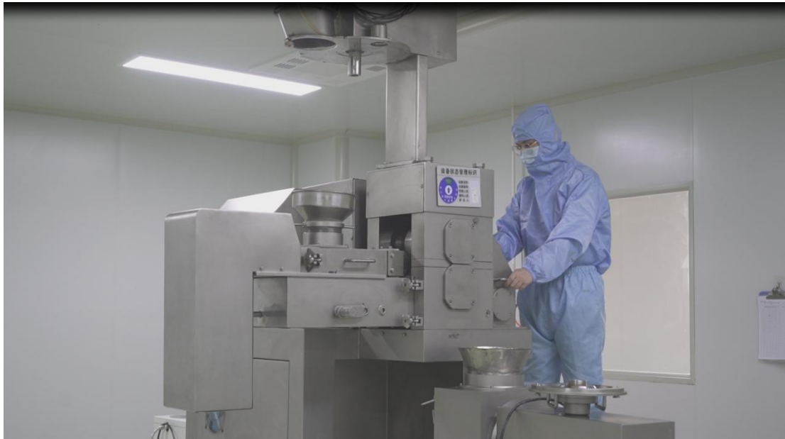
成果转化基地——大树食品养生固体饮料生产基地