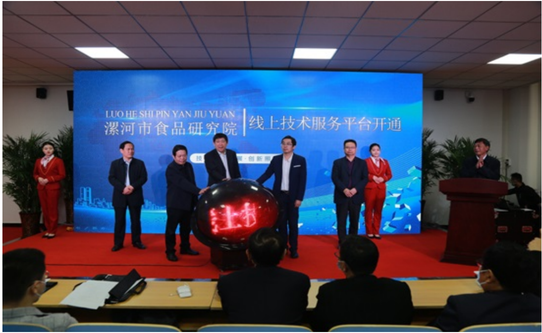
漯河市食品技术服务线上平台开通仪式