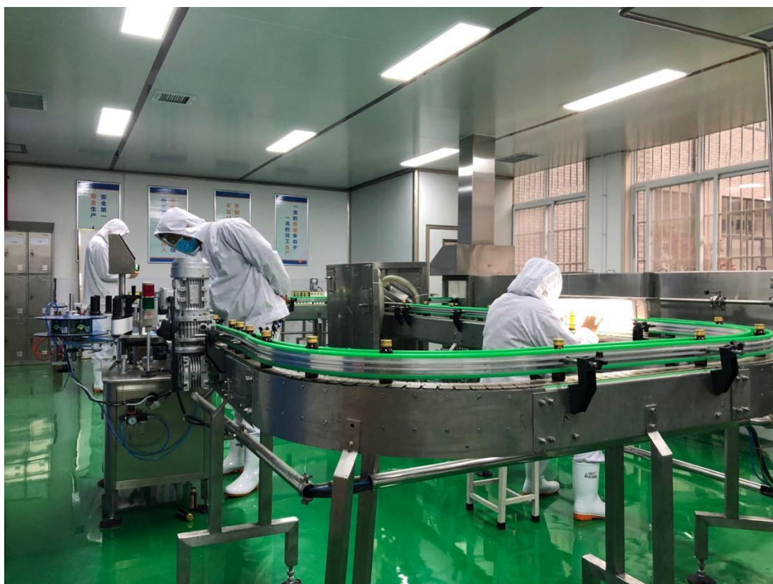
成果转化基地——和生食品功能性口服液生产基地