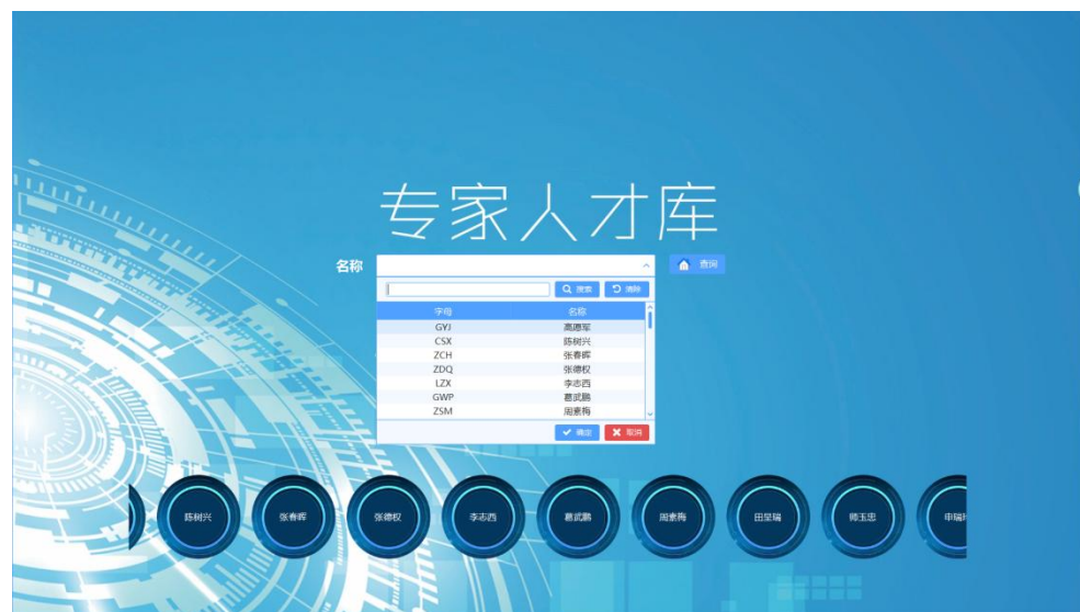
漯河市食品产业技术市场企业技术需求库、食品科技成果库、专家人才库