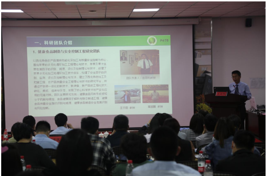
学校主办的中国（漯河）高校科技成果发布会顺利举行