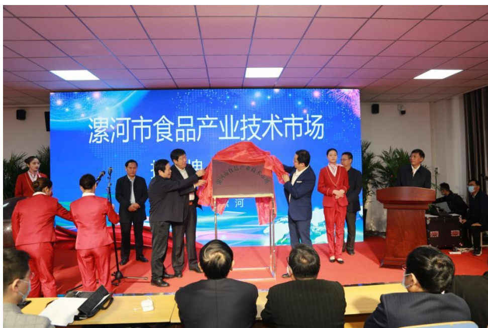
漯河市食品产业技术市场批复、揭牌仪式