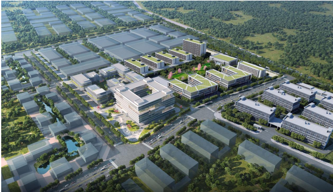
已全面开工建设的河南省食品科创园