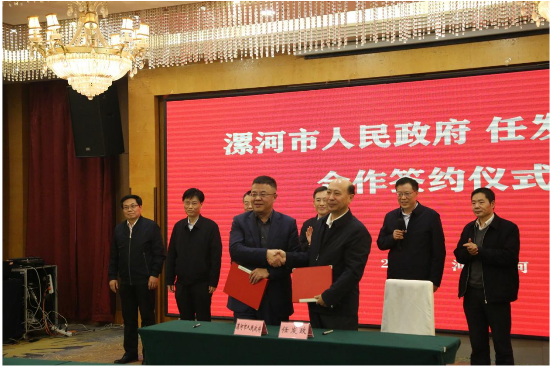
中国工程院院士任发政领衔建设中原食品实验室