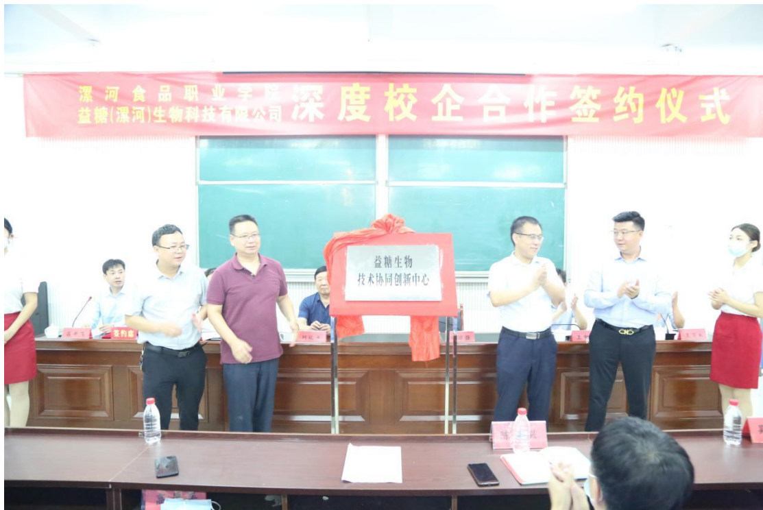
学校与益糖生物共建“益糖技术协同创新中心”