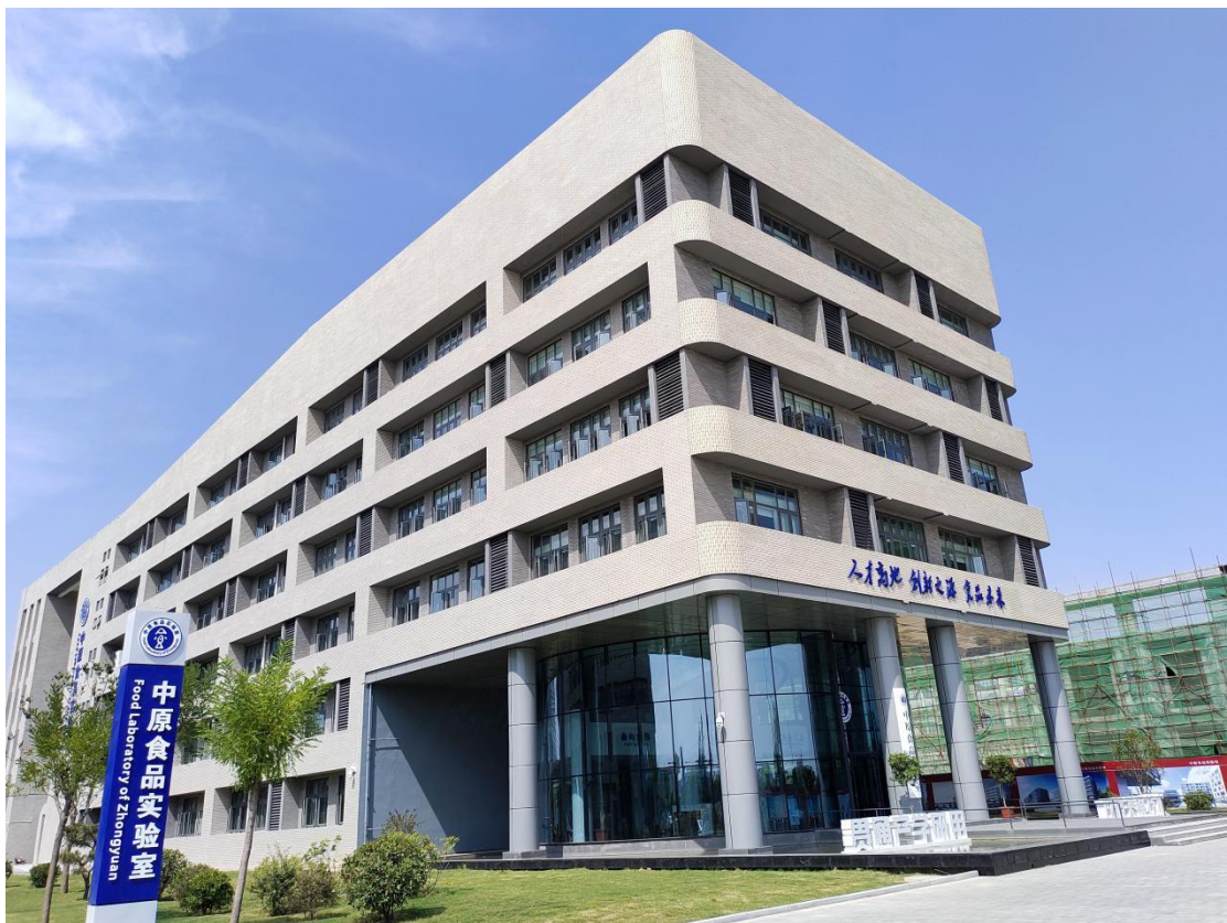
省政府重点建设的十大实验室之一——中原食品实验室