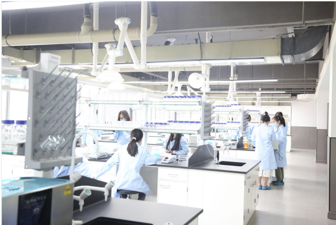
中原食品实验室科研人员开展课题研究