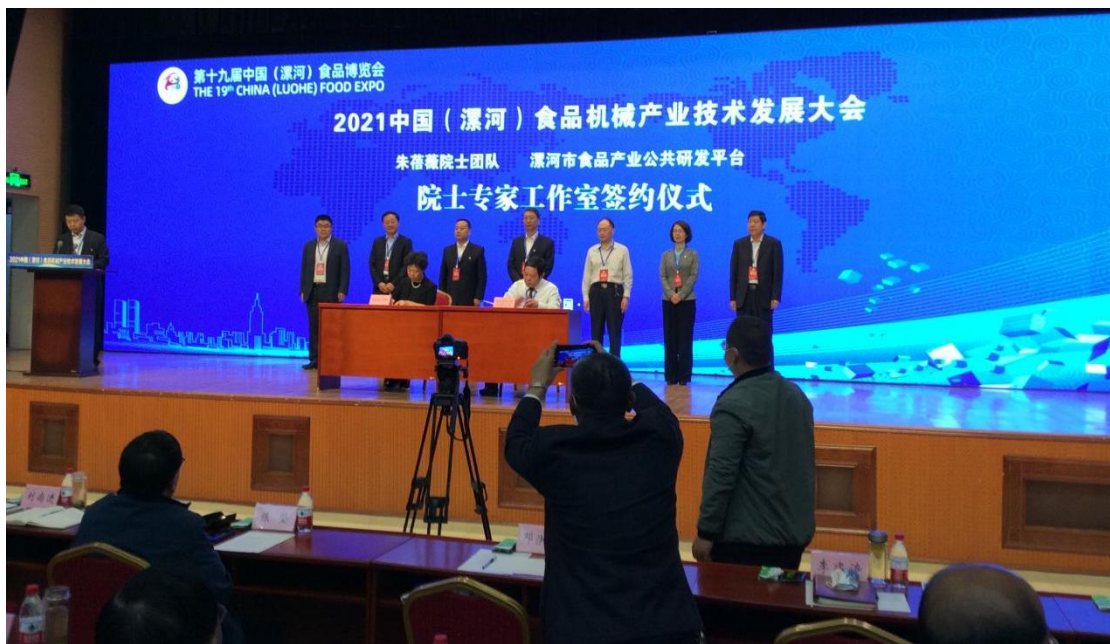
中国工程院院士朱蓓薇专家工作室落户漯河市食品产业公共研发平台