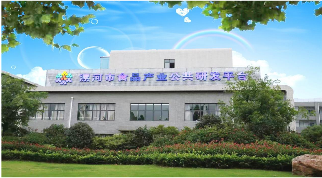
国家级应用技术协同创新中心——漯河市食品产业公共研发平台