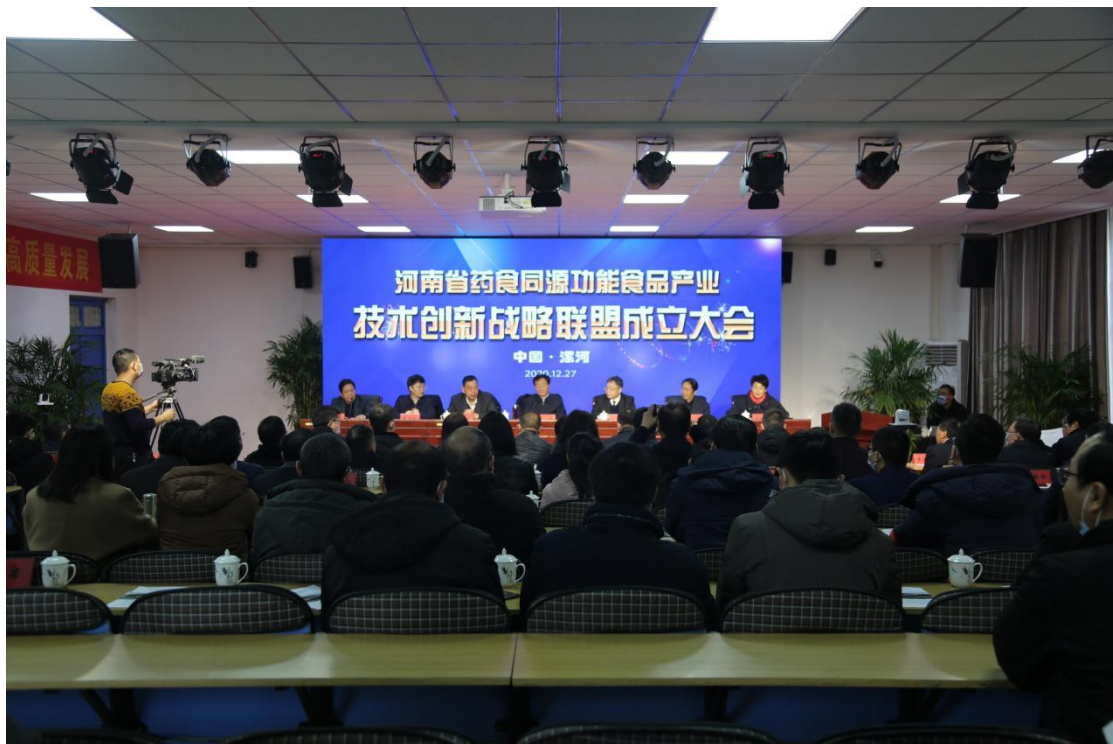
学院牵头成立的河南省药食同源功能食品产业技术创新战略联盟