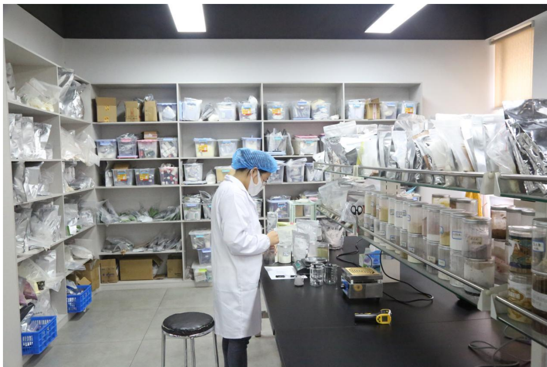
学校教师在公共研发平台开展课题研究