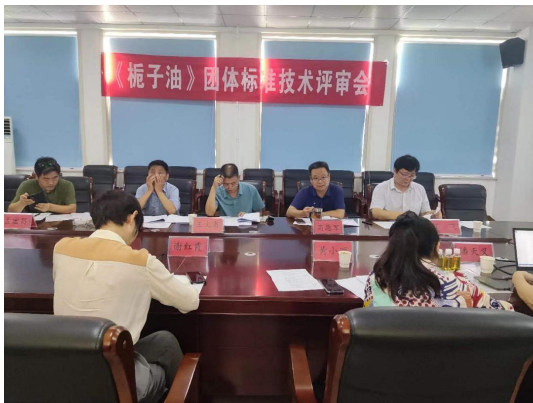
《桐子油》团体标准技术评审会