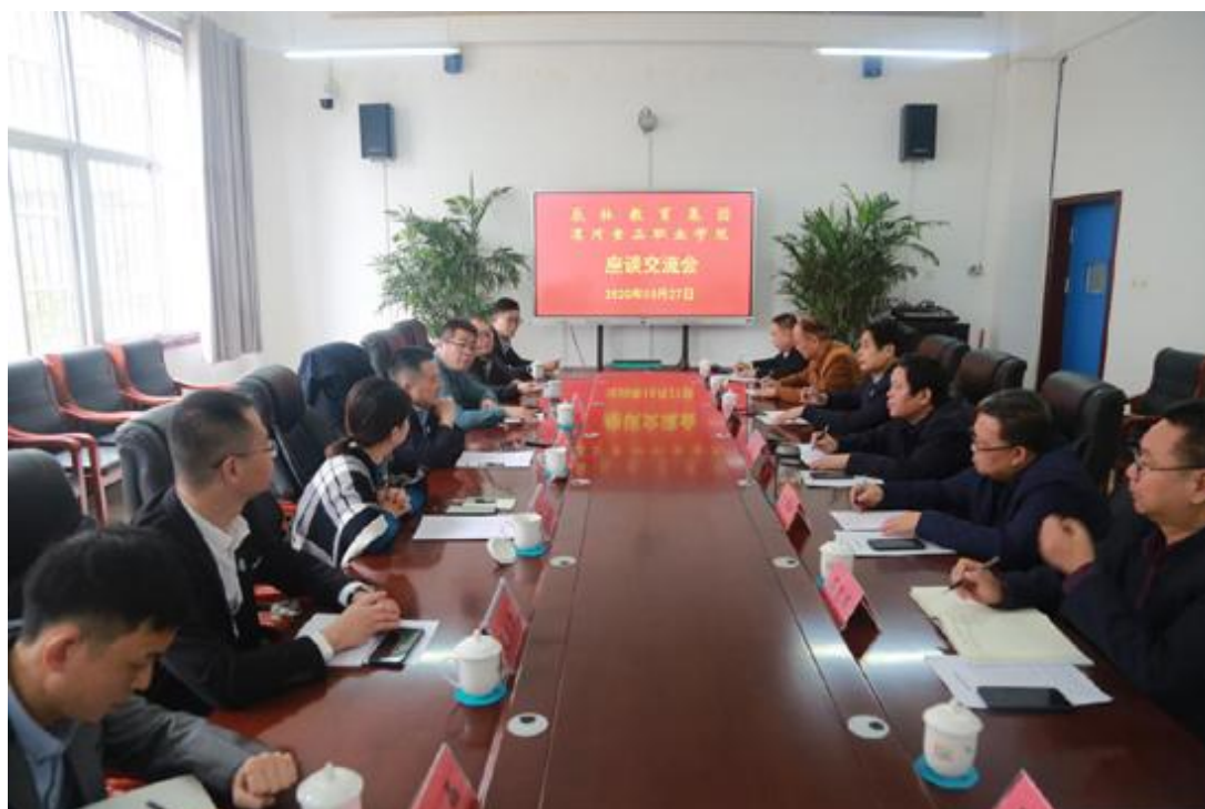
辰林教育集团 江西应用科技学院来访