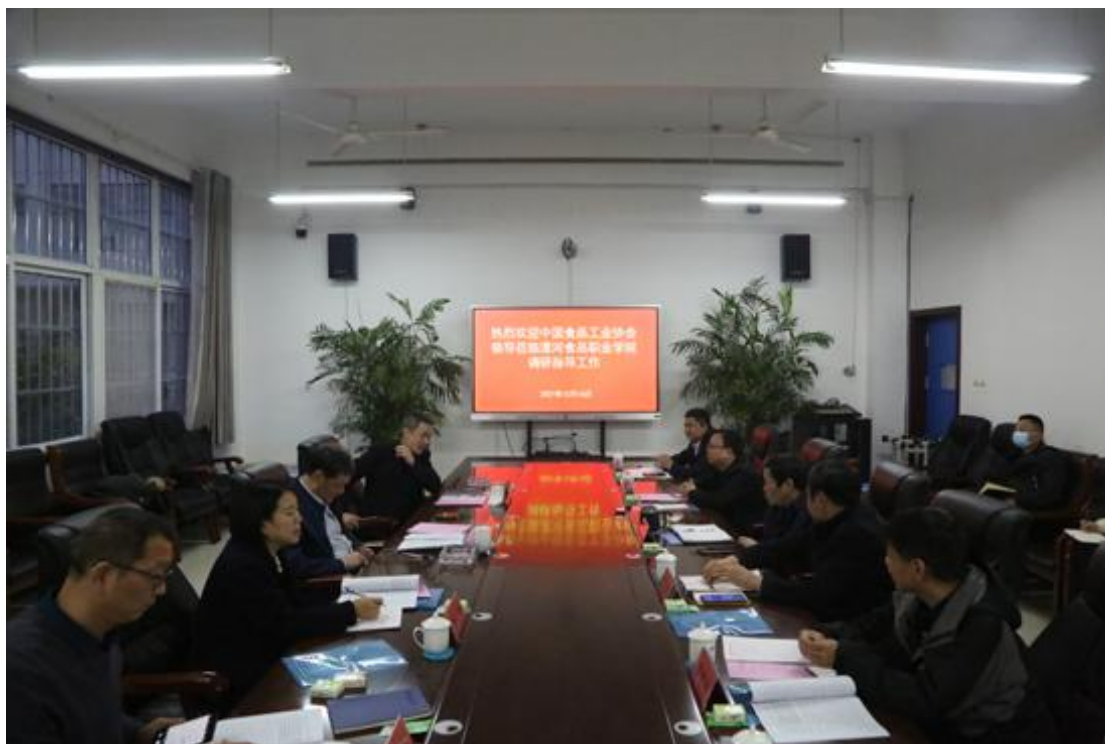
中国食品工业协会来访