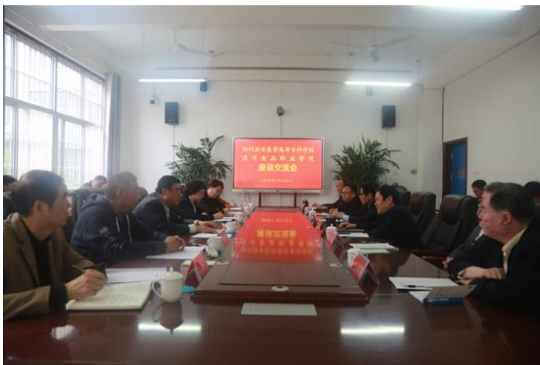
郑州澍青医学高等专科学校来访