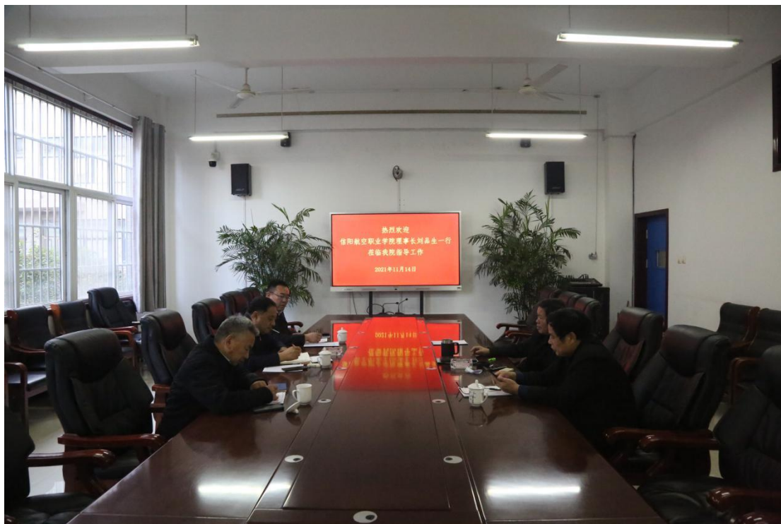
信阳航空职业学院来访