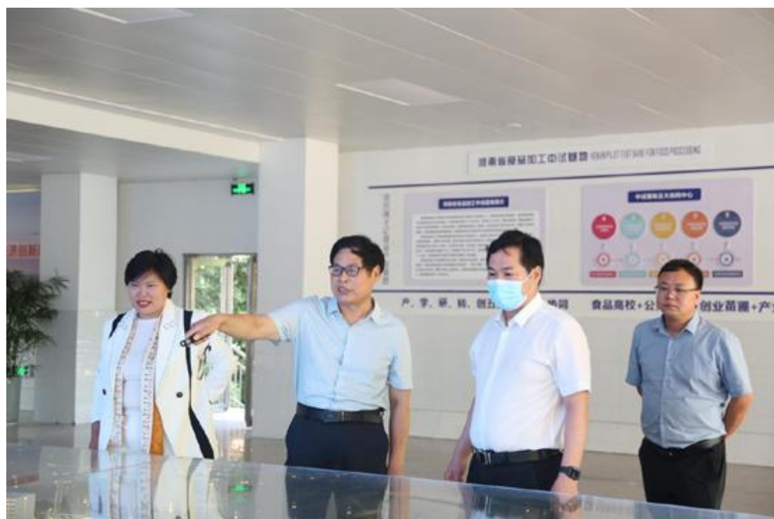
驻马店职业技术学院来访