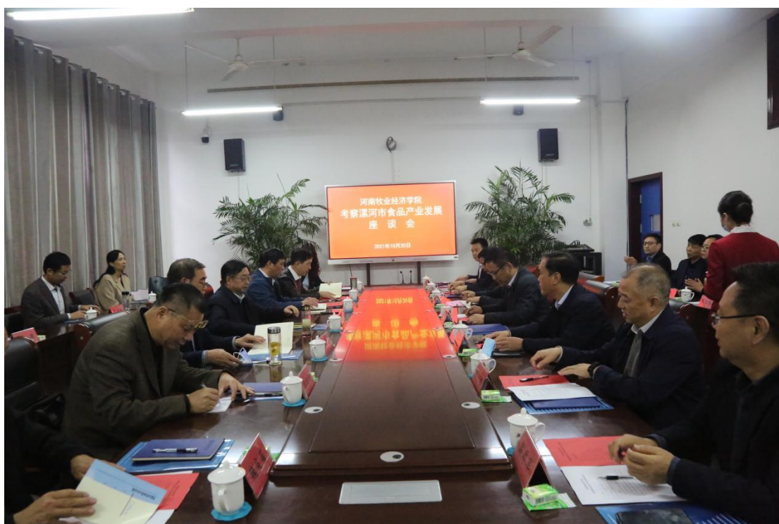
河南牧业经济学院来访