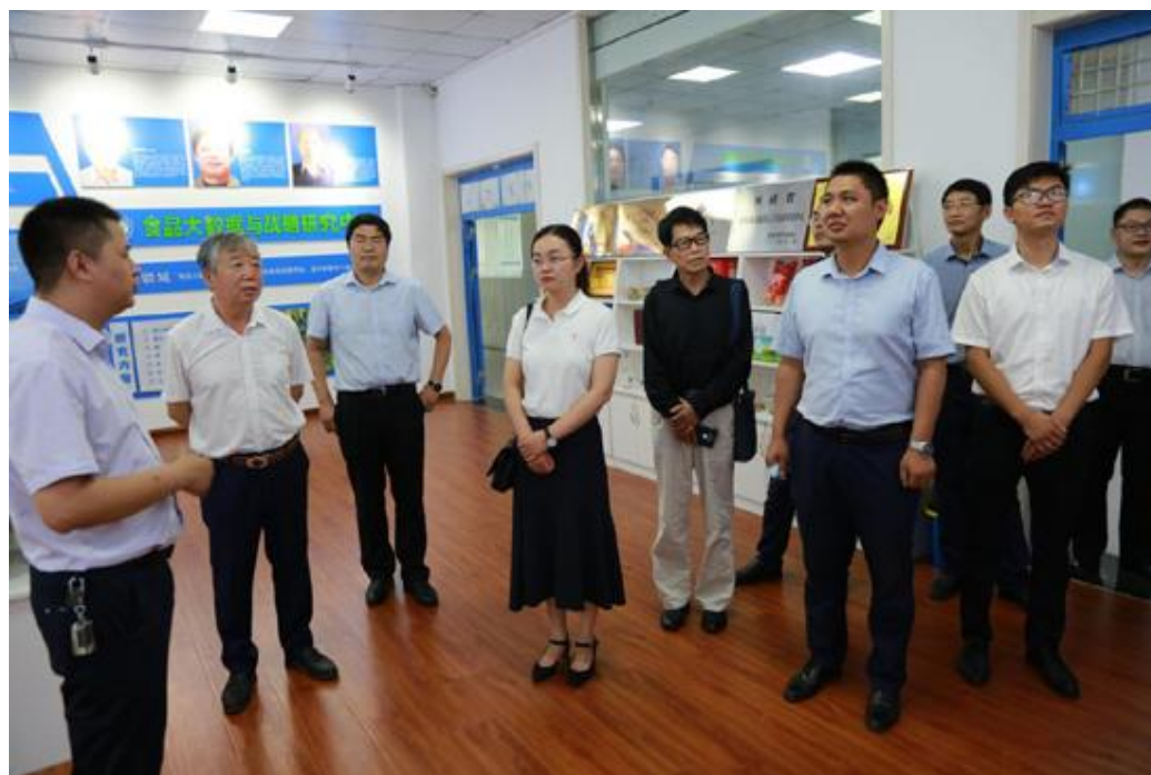
郑州信息工程职业学院来访