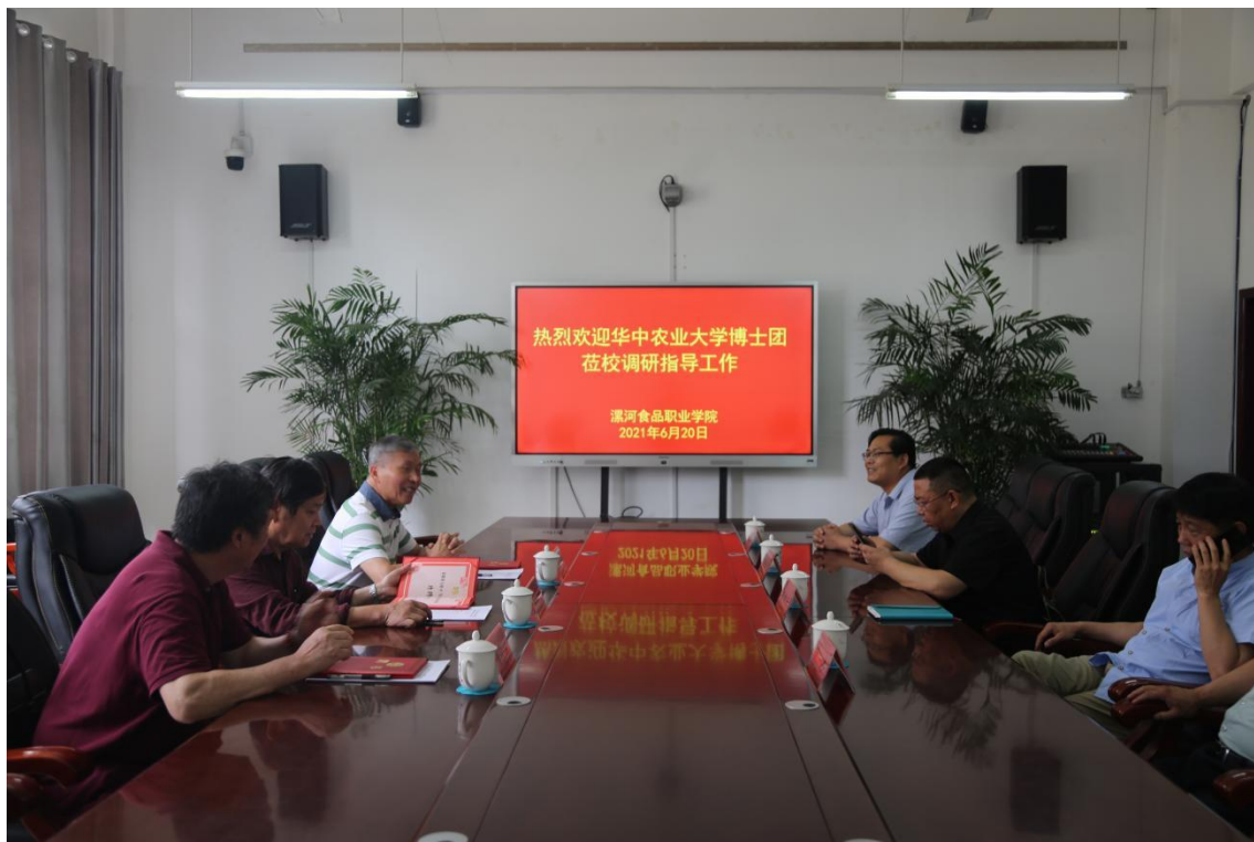
华中农业大学来访