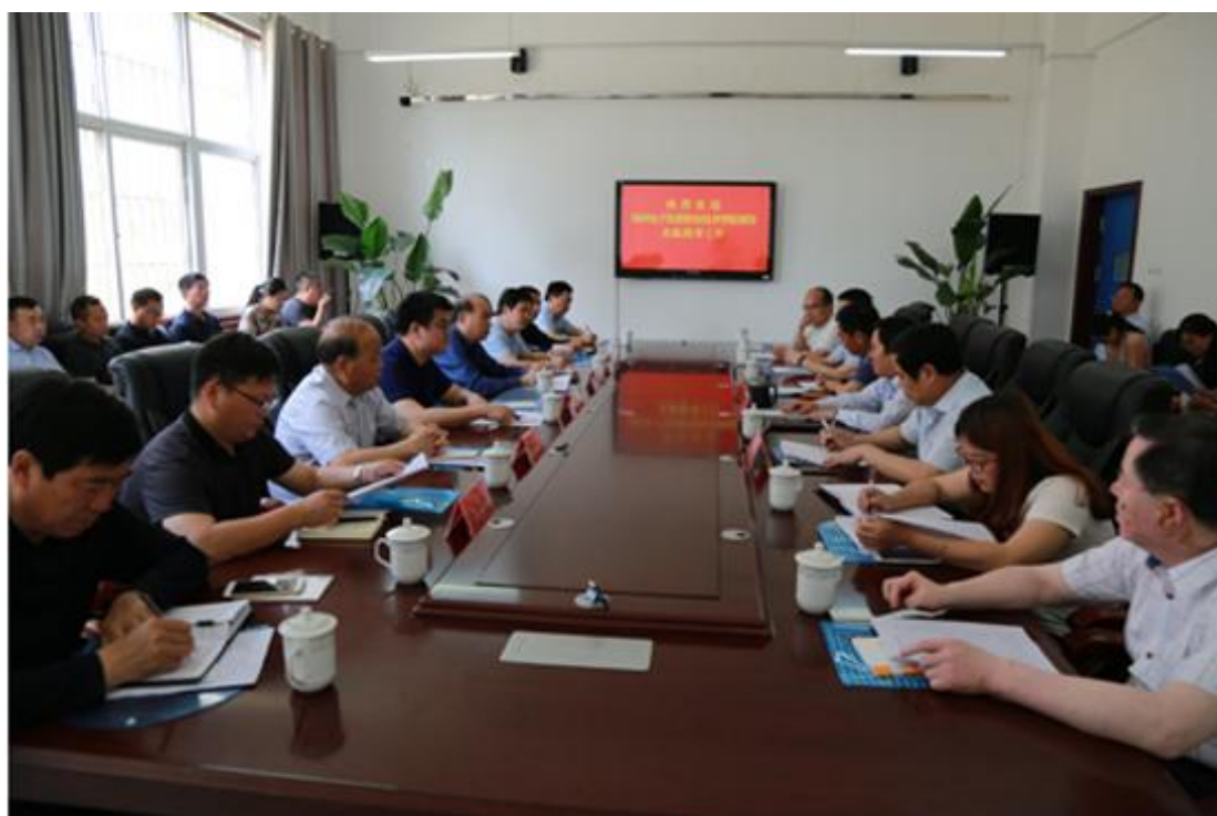
郑州电子职业技术学院来访