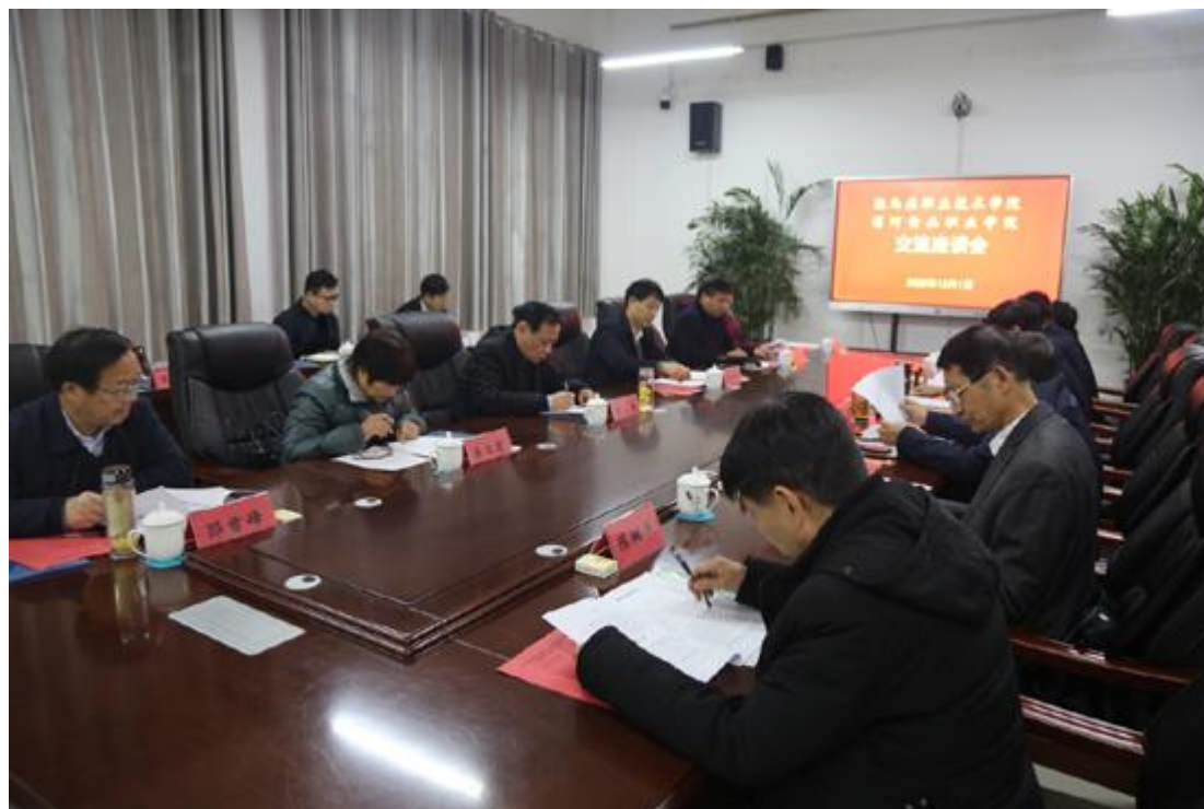
驻马店职业技术学院来访