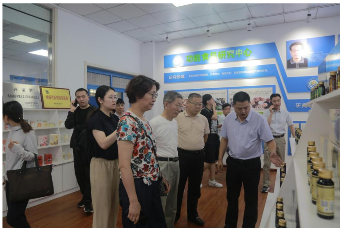
中国农业大学来访