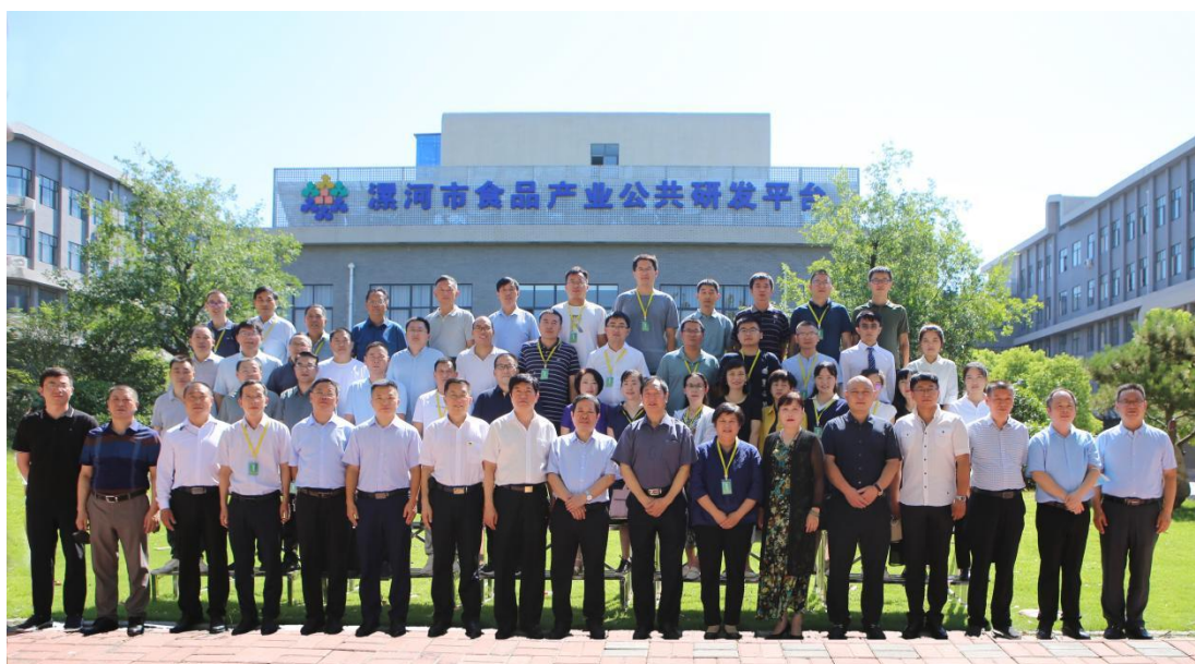
2022年8月11日河南省药食同源功能食品产业技术创新战略 联盟高端论坛合影