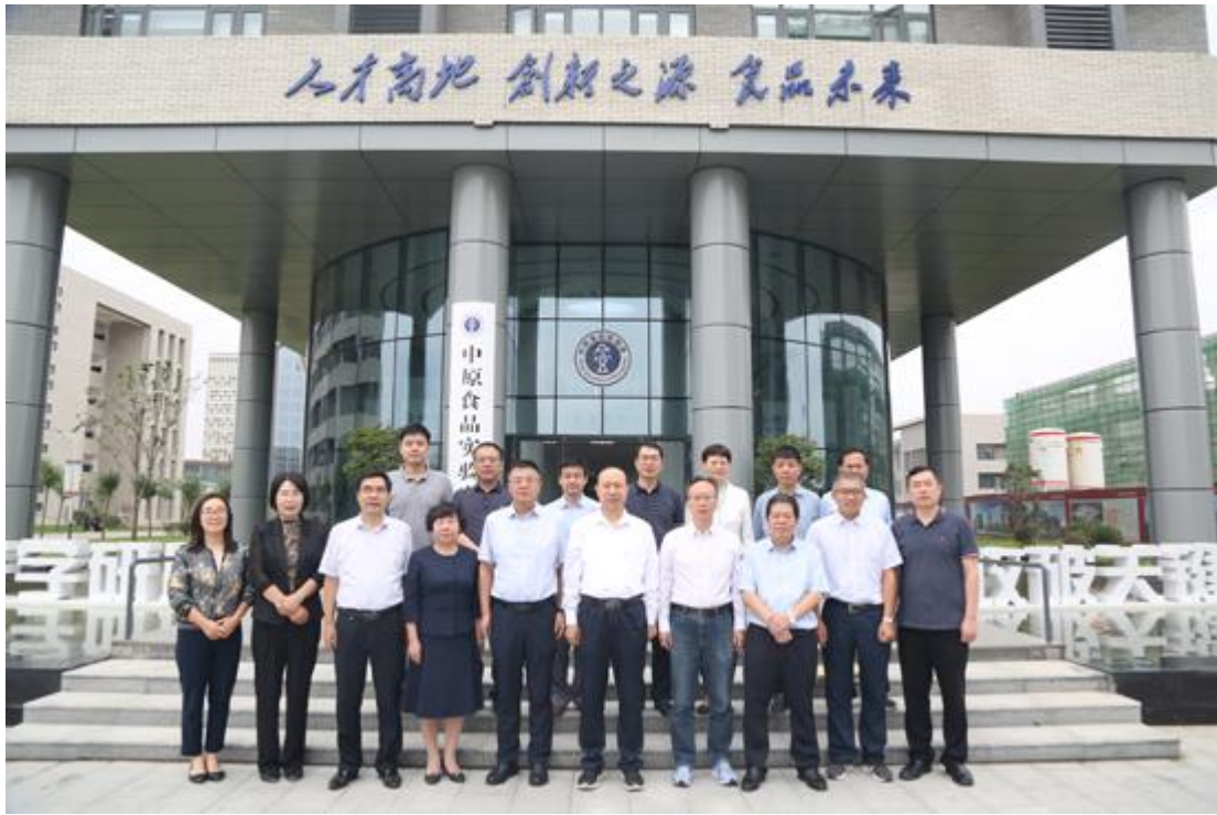
2022年9月2日 中国工程院院士任发政（中间）来漯河 调研合影