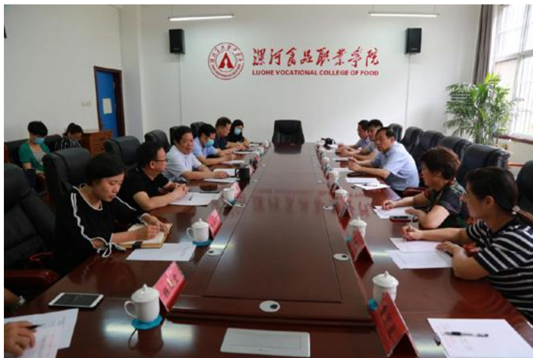
驻马店职业技术学院来访