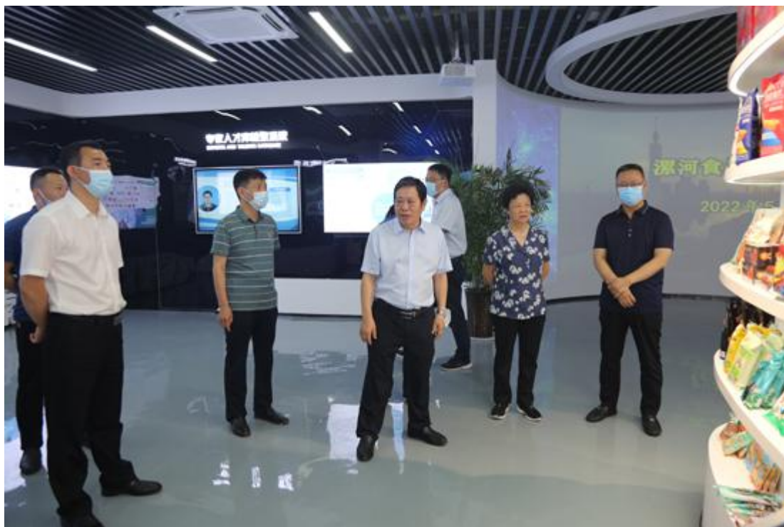
2022年7月5日中国工程院院士朱蓓薇（右二）调研漯河食品 产业公共研发平台